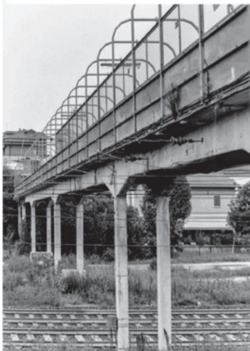
La passerella ciclopedonale tra via D'Annunzio e via Vaccari collega il quartiere dei Ferrovieri al resto della città. Un ponte non solo fisico, ma anche simbolico: un luogo di transito, incontri e storie, dove persino amori sono sbocciati.