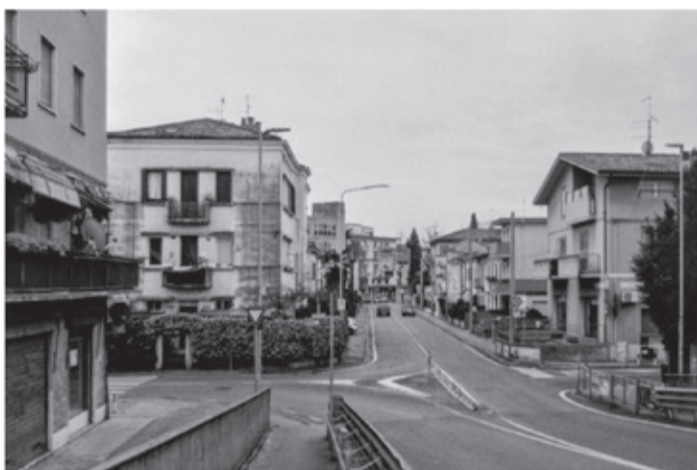
Vista dal cavalcavia Ferreto de Ferreti: nodo logistico essenziale che unisce il quartiere dei Ferroviari a San Lazzaro, offrendo uno dei pochi accessi verso Nord della città.