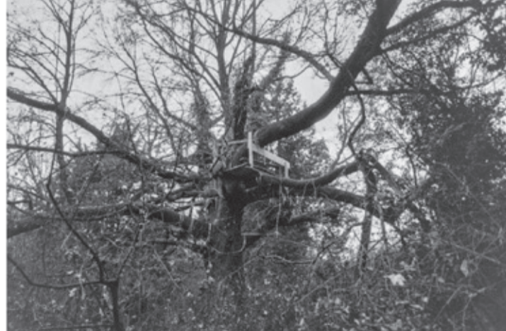
Il Liquidambar styraciflua del bosco Lanerossi si erge maestoso, quasi a emulare la grandezza e la forza attribuite al Cedro del Libano. Come il cedro, simbolo d'incorruttibilità e immortalità, questo albero rappresenta la resistenza della natura, preservando l'essenza del luogo dall'inevitabile trasformazione.