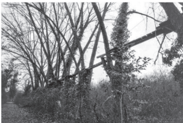
L'ingresso del bosco Lanerossi, nato nell'area dell'ex Pettinatura Lanerossi, chiusa dal 1994. Abbandonato per decenni, il luogo si è trasformato in un bosco selvaggio dove la biodiversità ha trovato spazio per prosperare.