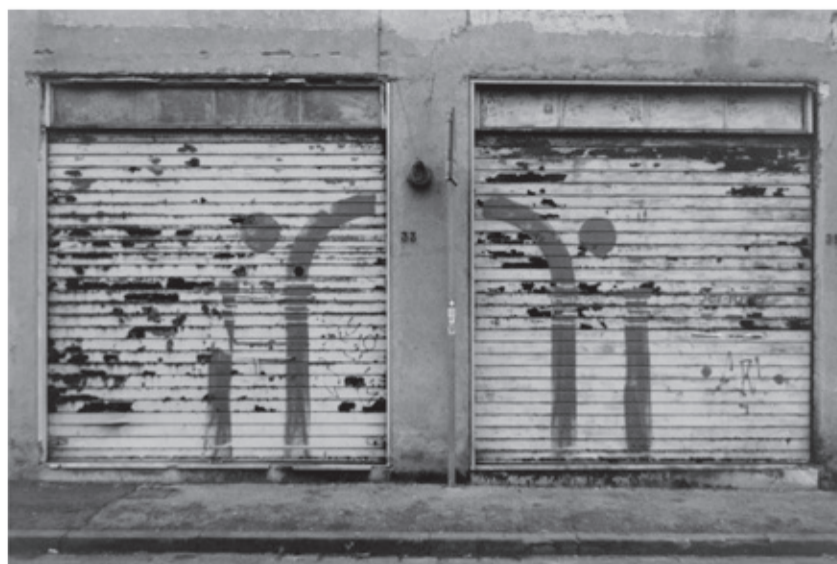
"Ferrovieri e* Vicenza" scattata all'inizio di Via Alessandro Rossi, questa immagine invita a riflettere sul legame tra il quartiere e la città. L'asterisco sulla 'e' lascia allo spettatore la scelta: è un accento che segna appartenenza o un segno di semplice estensione? Una domanda sospesa nel tempo e nello spazio urbano.