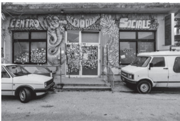
Il Centro Sociale Bocciodromo è un luogo che promuove realtà sociali e associative, mettendo al centro la tutela del territorio e delle persone. Tra i progetti: una palestra indipendente, un Jazz Club, un'osteria e un atelier.