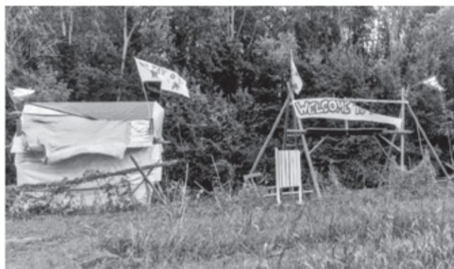
Bosco di Cà Alte, qui il Woods Climate Camp 2024 ha accolto partecipanti da tutta Italia, diventando simbolo di riflessione e lotta per il clima, in uno scenario naturale ora minacciato dalla trasformazione del territorio.

Non solo un documento visivo, ma anche un invito a osservare, a ricordare e a immaginare come il nostro presente dialoga continuamente con il passato e il futuro.