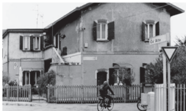
Proseguendo per Via Cà Alte, l'architettura semplice e vissuta racconta storie di quotidianità e di un passato che ancora resiste. Un ciclista attraversa il presente, tra la quiete di oggi e i cambiamenti che verranno.