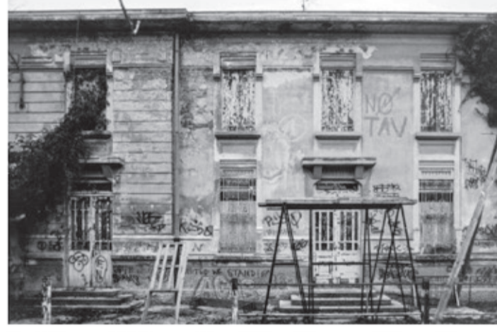
Un edificio segnato dal tempo e dalle voci del quartiere, con graffiti e segni che raccontano tensioni, proteste e storie silenziose. Un luogo che porta su di sé il peso del cambiamento.