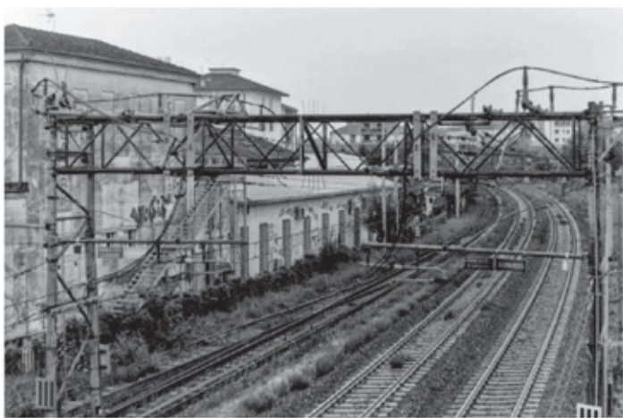
I binari visti dal cavalcavia Ferreto de Ferreti: un'altra prospettiva che svela l'intreccio tra il quartiere e le linee ferroviarie.