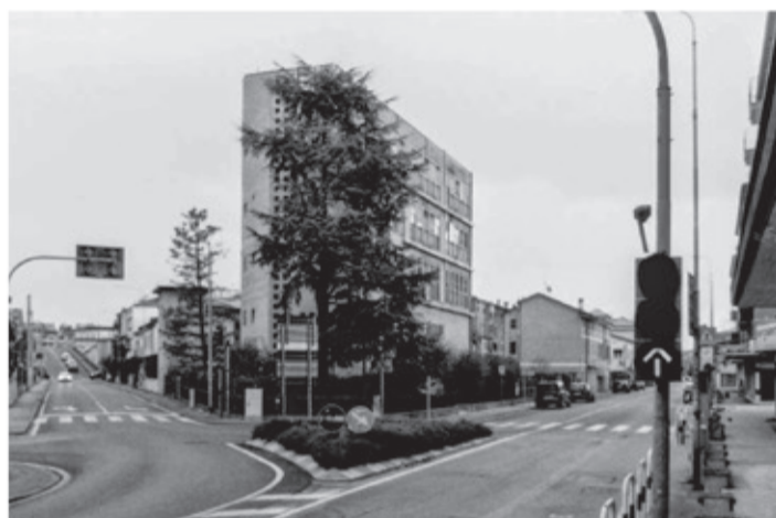
I Scattata da Via Giuseppe Vaccari, la foto abbraccia la sede della CGIL, il cavalcavia Ferreto de Ferreti e la strada verso la passerella ciclopedonale, simboli di un quartiere dinamico e connesso.