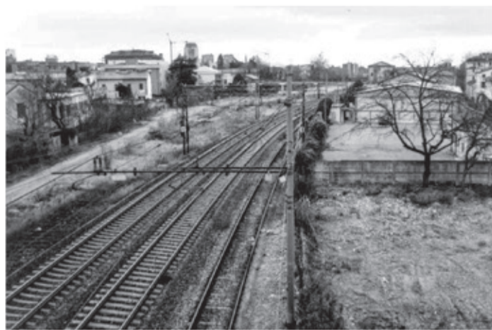
I binari visti dal cavalcavia Ferreto de Ferreti: un'altra prospettiva che svela l'intreccio tra il quartiere e le linee ferroviarie.