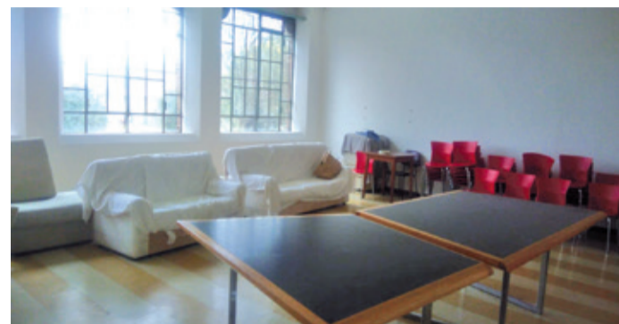
L'aula studio in allestimento.

stanze dell'ex casa delle suore. La struttura inizialmente necessitava di alcuni lavori dei quali si sono occupati gli animatori dei giovanissimi con l'aiuto di alcuni volontari: la pulizia profonda, la ritinteggiatura dei muri dell'aula e la selezione dei mobili sono solo alcune delle migliorie attuate. I prossimi passi riguarderanno il vero e proprio arredamento della stanza per renderla funzionale ai propri scopi e la definizione degli aspetti legati agli orari di apertura